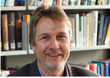
Friedrich Alexander Nürnberg Erlangen Üniversitesi Sosyoloji Profesörü