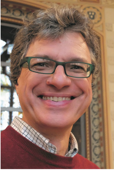
Viyana Üniversitesi Uluslararası Kentsel Sosyoloji Profesörü